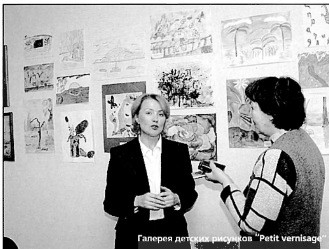
Галерея детских рисунков "Petit vernisage"