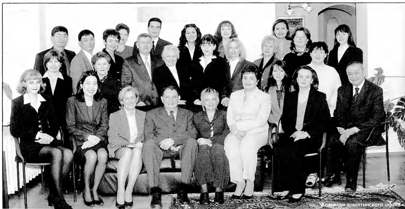
Команда алматинского офиса

Естественно, по мере роста нашей практики расширялись и мы. Вначале была одна комната, потом две, потом четырехкомнатная квартира в микрорайоне «Коктем». Ну а сейчас - четырехэтажный офис в Алматы, плюс филиалы в Астане и Атырау. Общий штат нашей фирмы на сегодняшний день составляет более 30 человек.